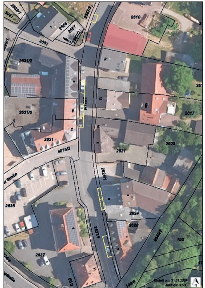
Lageplan der markierten Parkflächen

Ausweichparkmöglichkeiten sind außerdem auf dem Parkplatz in der Industriestraße sowie am Rathaus zu finden.