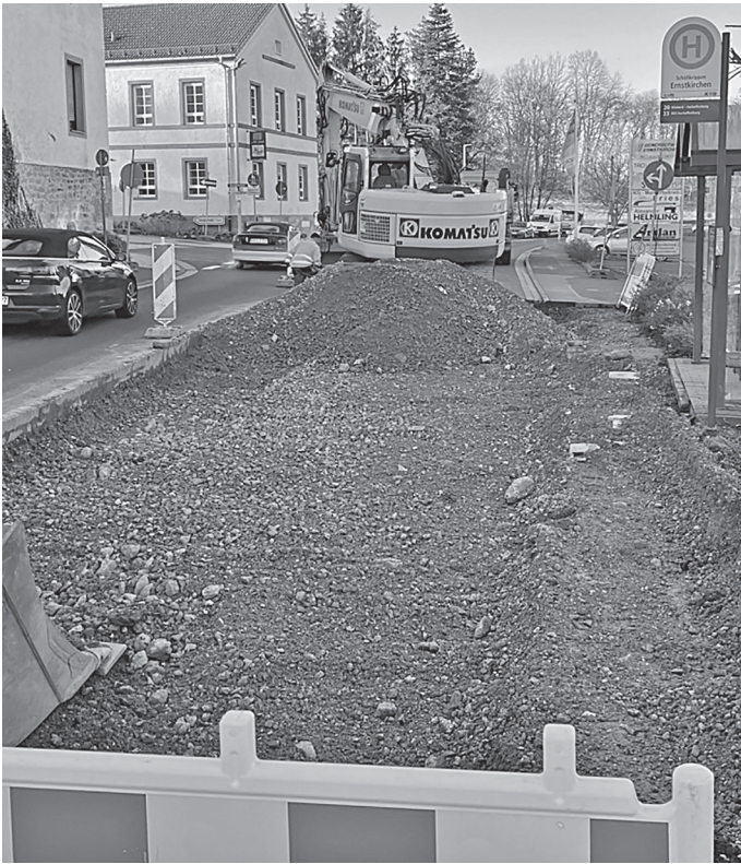
Abbrucharbeiten Aschaffener Straße