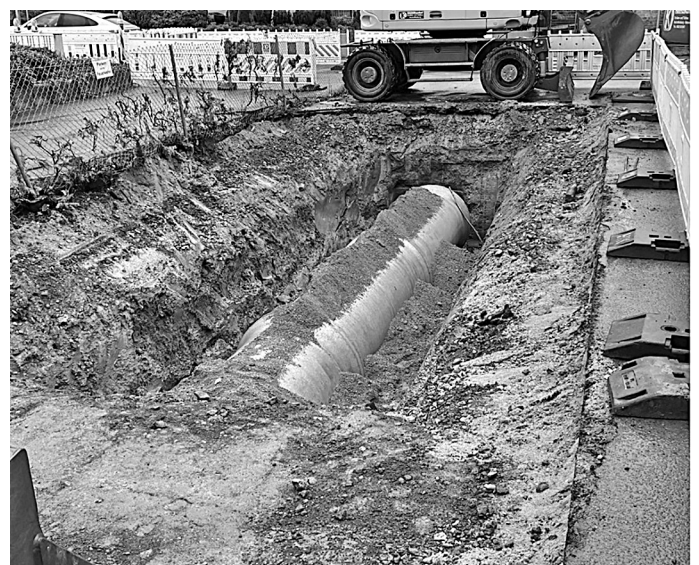
Kanalbauarbeiten auf dem Feuerwehrgelände

Bauabschnitt 1: Abbrucharbeiten mit anschließenden Kanalbauarbeiten im Bereich der Bushaltestelle Ernstkirchen.