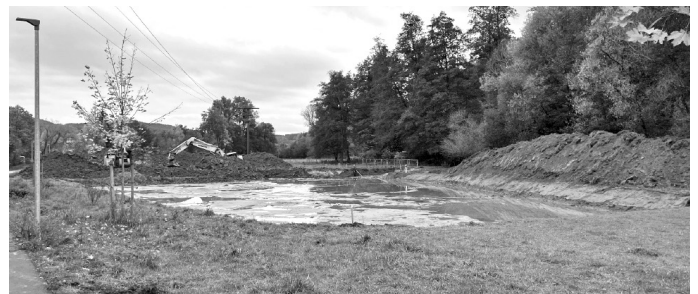
Bau des neuen Regenrückhaltebeckens

Voraussichtliche Dauer (nicht verbindlich) Oktober 2022 bis Dezember 2022